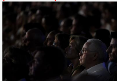
Christoph Blocher, lors de la projection du film à Locarno (SP)

Festival de Locarno 2013 (Piazza Grande)